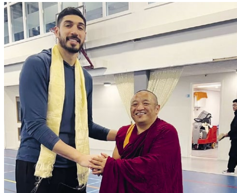
Enes Kanter Freedom mit Abt Tenzin Jangchup