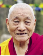
Gendün Gyatso Acharya Sakya Tradition In Rikon seit 1979