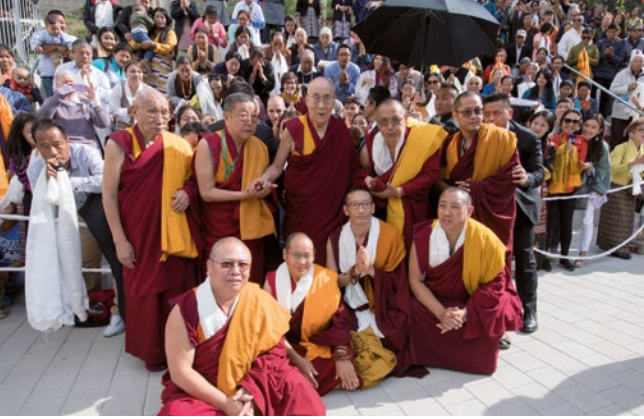
S. H. der Dalai Lama und die Mönchsgemeinschaft am Jubiläumsanlass im Tibet-Institut (21.09.2018)