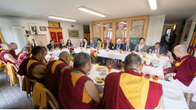
S. H. der Dalai Lama und Mönchsgemeinschaft, Stiftungsrat und Mitarbeitende des Tibet- Instituts beim Mittagessen im Kloster (21.9.2018)