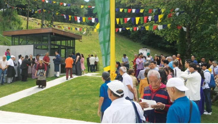
Das neue Lichtopferhaus wird am Kalachakra-Gedenktage seiner Bestimmung übergeben (28.7.2018)