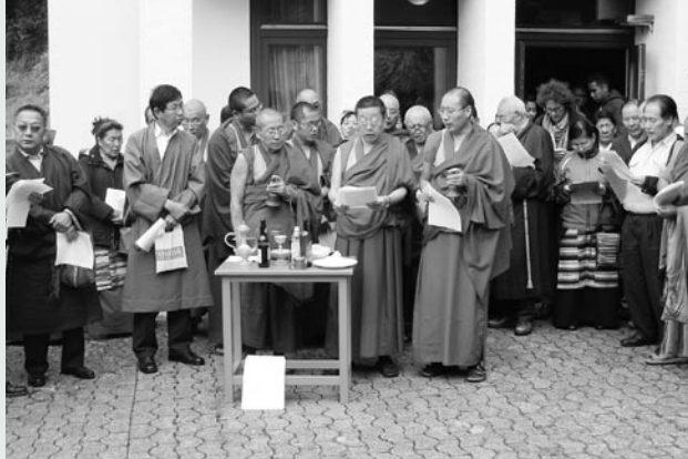
Feier zum 72. Geburtstag S.H. des Dalai Lama im Tibet-Institut (6.7.07).