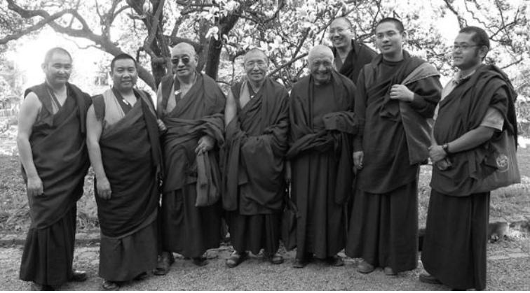
Die Mönchsgemeinschaft beim Besuch der Kannon-Ausstellung im Museum Rietberg Zürich (6.4.07)